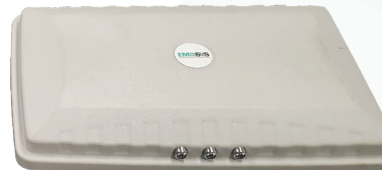
EMSYS LSRS Transmisor y Receptor